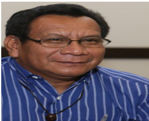
Figura 4 – Gersem Baniwa

O papel exercido por Gersem Baniwa não só na academia e na política, mas sobretudo na sociedade e na divulgação da história, memória e cultura indígena, tem um papel extremamente relevante para esses povos, pois descortina uma série de questões que além de agregar, também evidenciam a cultura, os costumes, as tradições, a língua, entre outras nuances dos povos da floresta.