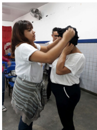
Figura 5 - Oficina de Turbantes. 8ºD