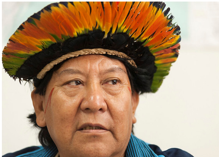
Figura 2 - Davi Kopenawa

abordando parte da trajetória de Davi Kopenawa, xamã e liderança do povo da Terra Indígena Yanomami, localizada no estado de Roraima. Sua luta em defesa dos direitos do povo Yanomami é reconhecida no Brasil e no exterior, principalmente pelo seu engajamento no processo de demarcação dessa Terra Indígena (TI) em 1992 e da batalha contra a invasão do garimpo.