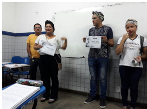
Figura 6 – Divulgando a feira