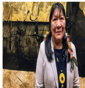
Figura 6 – Joênia Wapichana