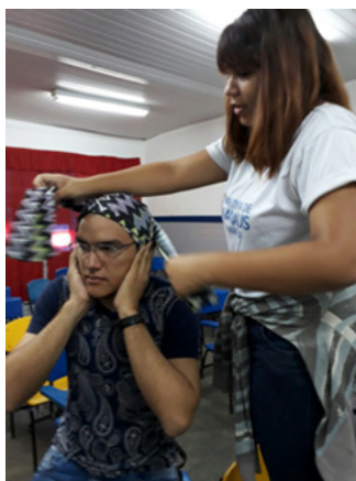
Figura 4 - Oficina de Turbantes. 8ºD